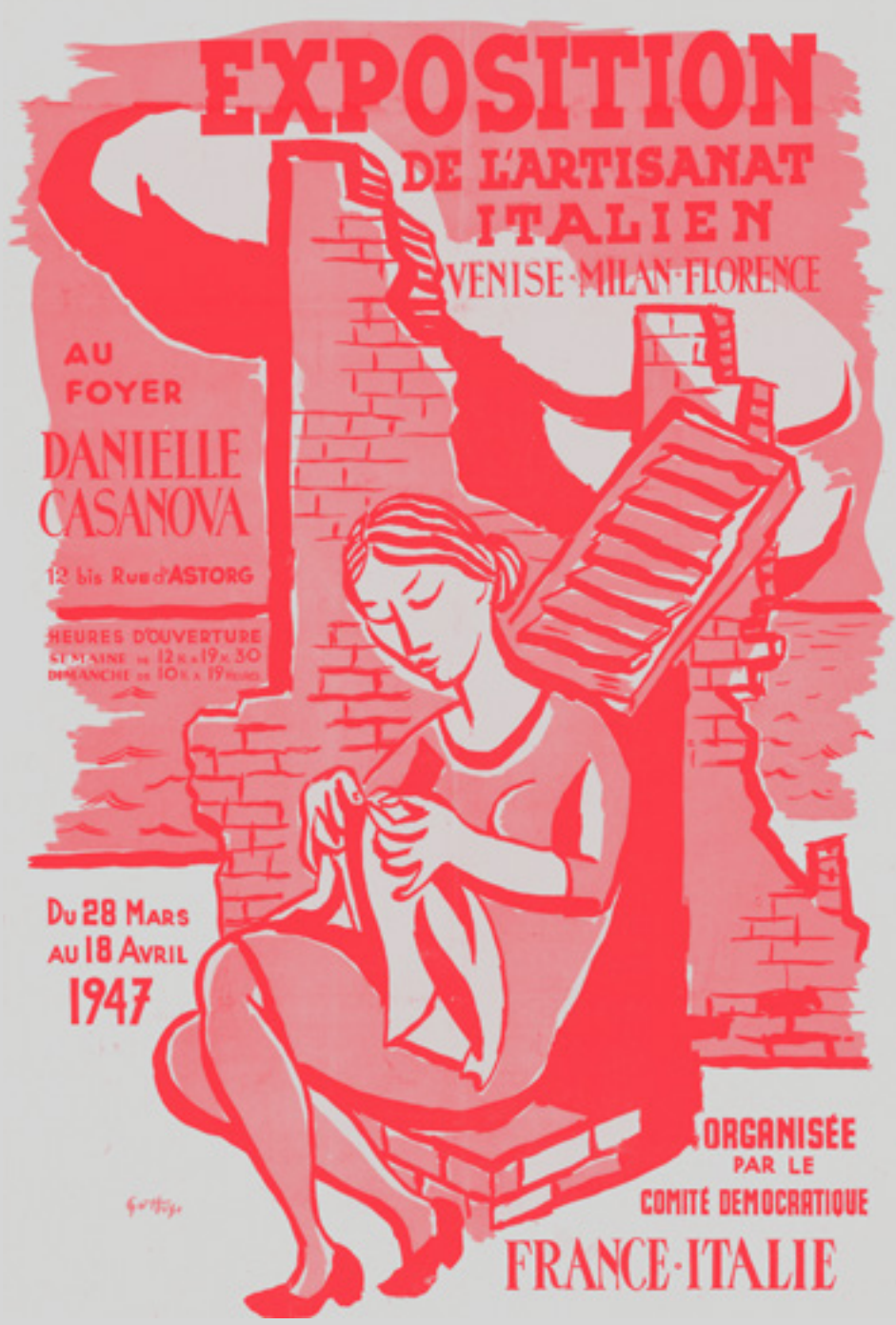
R. Guttuso, Exposition de l'artisanat italien. Venise-Milan-Florence , organisée par le Comité Democratique France-Italie (du 28 mars au 18 avril 1947)