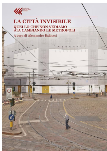
Alessandro Balducci (a cura di) La città invisibile (Fondazione Feltrinelli 2024)