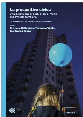
C. Caltabiano, T. Vitale, G. Zucca (a cura di) La prospettiva civica 10° Rapporto sull'Associazionismo Iref (Fondazione Feltrinelli 2024)