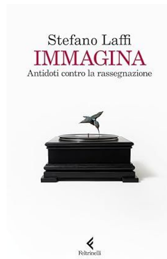
Stefano Laffi Immagina. Antidoti contro la rassegnazione (Feltrinelli 2025)

INDUSTRIE FLUVIALI via del Porto Fluviale 35, Roma