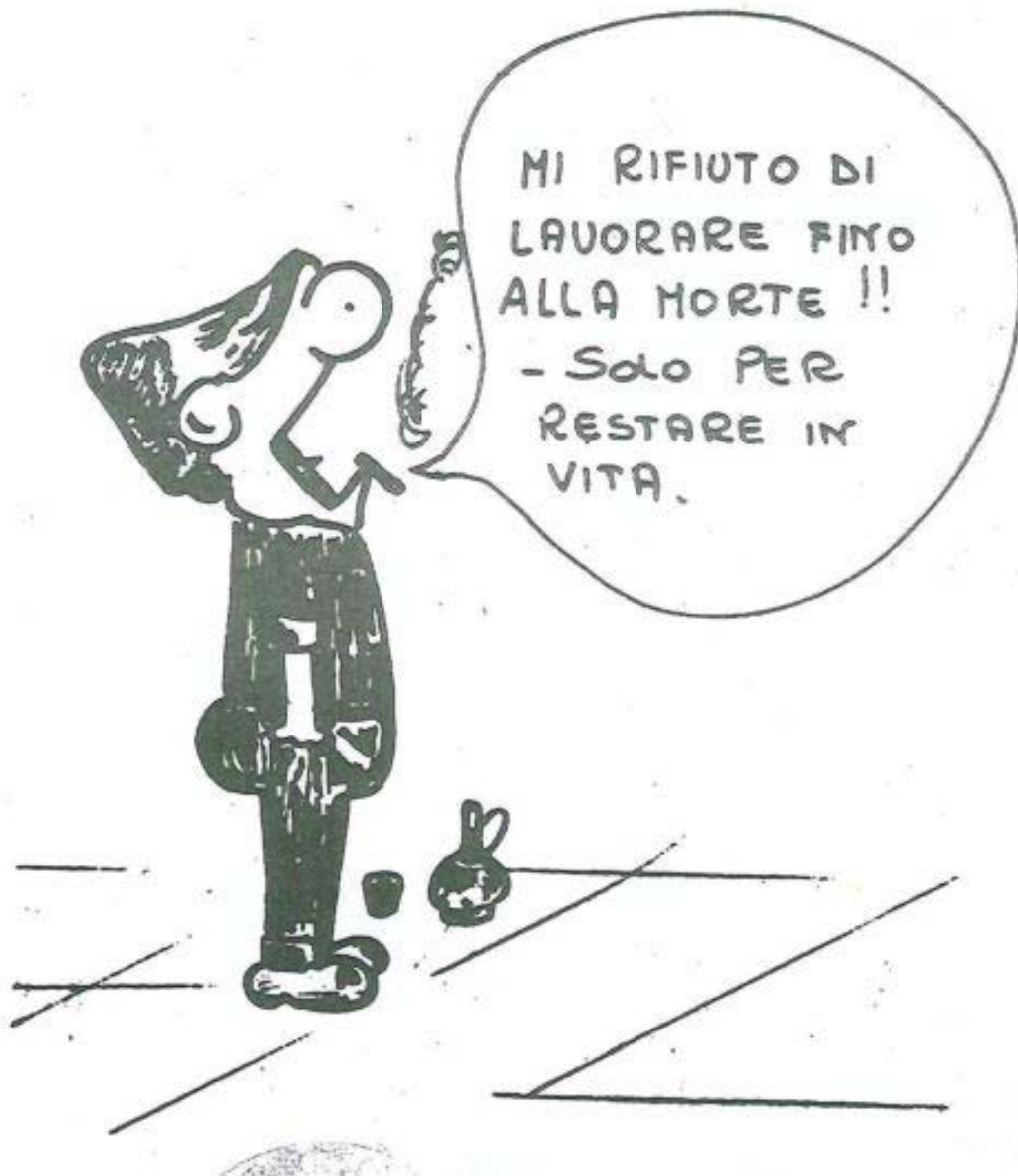
“L’escavatore”, giornale del Consiglio di Fabbrica della Link Belt, numero del maggio 1972